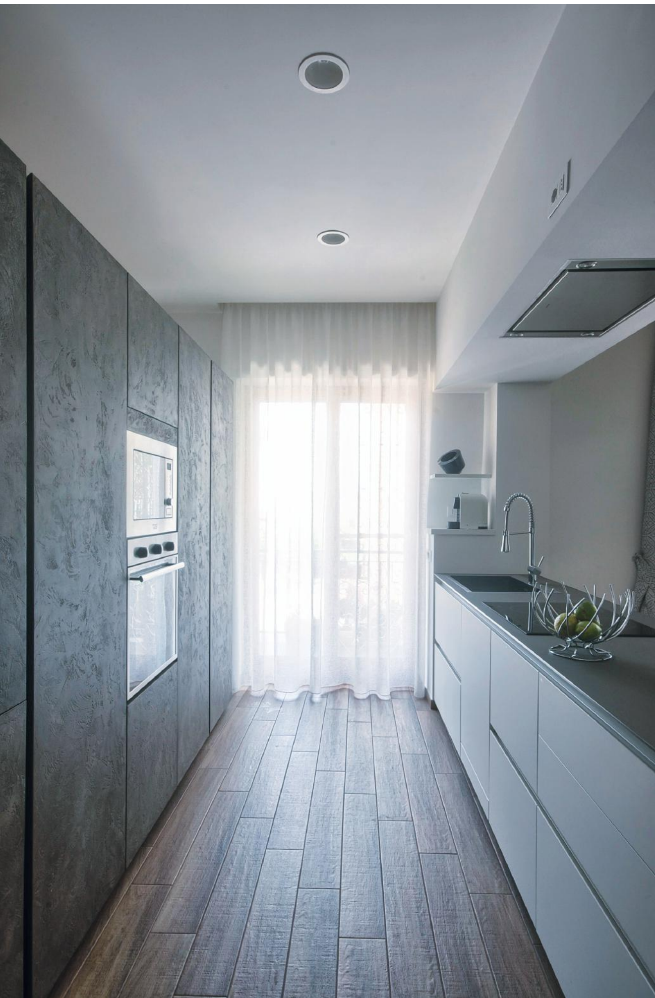
Cucina e sala da pranzo sono separate dalla penisola minimale